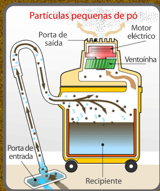
ASPIRADOR SEM SACO

No aspirador de saco, as partículas de pó de maior dimensão ficam presas dentro do saco; em poucos minutos, entopem-no e reduzem drasticamente o poder de sucção.