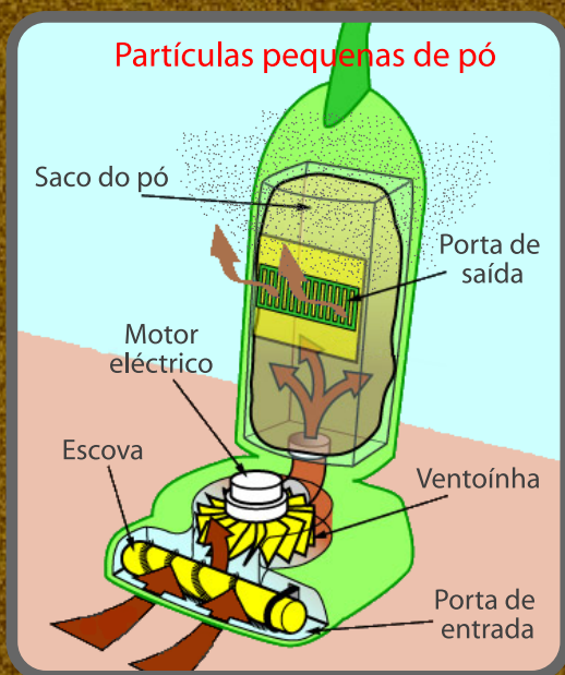
ASPIRADOR DE SACO

...por isso sente o cheiro a pó quando utiliza um aspirador comum